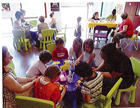
Une des animations ponctuelles de la Maison de la Famille réunissant les enfants et leurs parents.