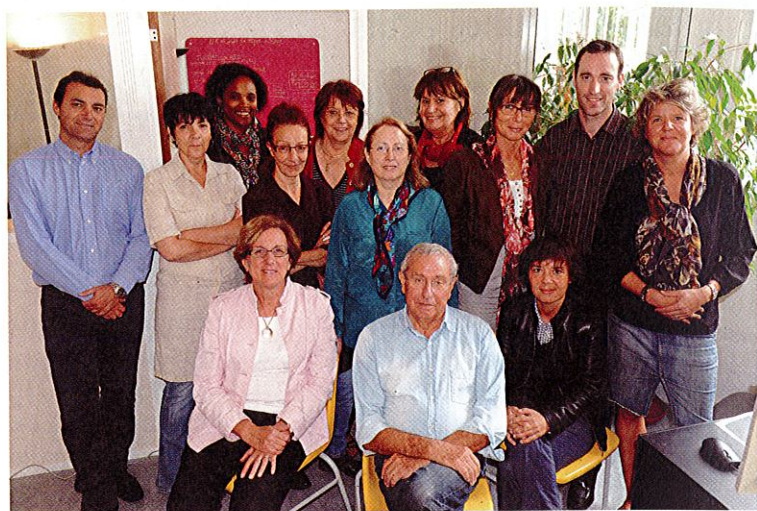
Une équipe compétente à votre service.

335 nouveaux donneurs d'ordre. En 2011, Active Présence a salarié 357 personnes, dont 203 nouveaux inscrits. Ces personnes ont réalisé 88 000 heures de mission auprès de 836 clients (entreprises, collectivités, syndicats de copropriétés, particuliers...). 335 nouveaux donneurs d'ordre ont fait appel à