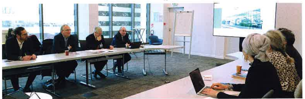
Lors de la réunion des directeurs des Affaires financières chez B.Braun en février dernier.